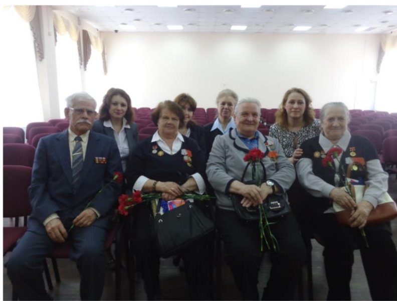
Встреча с малолетними узниками войны в актовом зале школы.

Третья группа создавала электронные презентации «Города герои». Для создания презентаций учащиеся класса посещали кружок информатики. Это было первой ступенькой для будущей работы. Ребята не только создавали презентации, но и выступали с ними перед классом. Одна из презентаций «БРЕСТ – город герой».