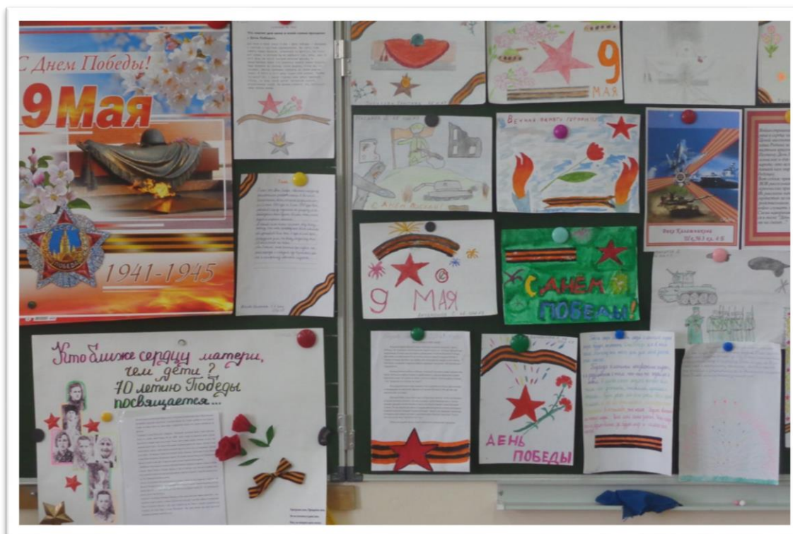
(Стенд посвящённый Великой Победе)

При реализации этого проекта каждый учащийся смог попробовать себя в роли, которая его интересовала больше всего. Дети получили удовольствие от проделанной работы. Навыки, полученные при работе над проектом, пригодятся ребятам в жизни.